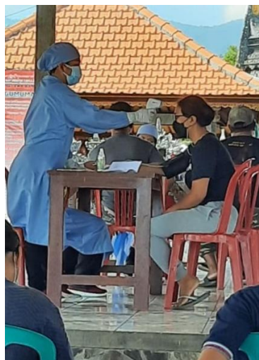
Eerst een gezondheidscheck...

Ondertussen wordt er al enkele maanden gevaccineerd. Men is begonnen bij de zorgmedewerkers en de ouderen en daarna komt de groep van 18 tot 60 jaar aan de beurt.